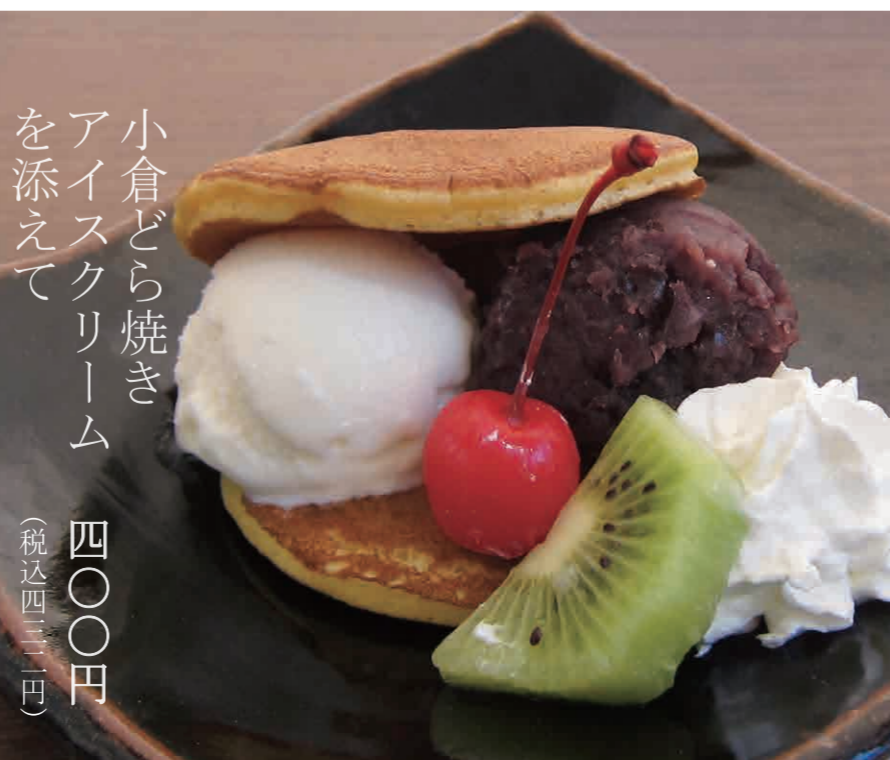
小倉どら焼き アイスクリーム を添えて 四〇〇円 (税込四三三円)