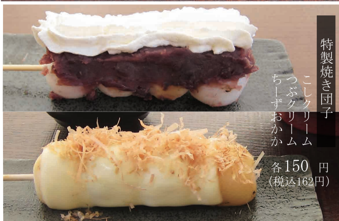
特製焼き団子 こしクリーム つぶクリーム ちーずおかか 各150円 (税込162円)