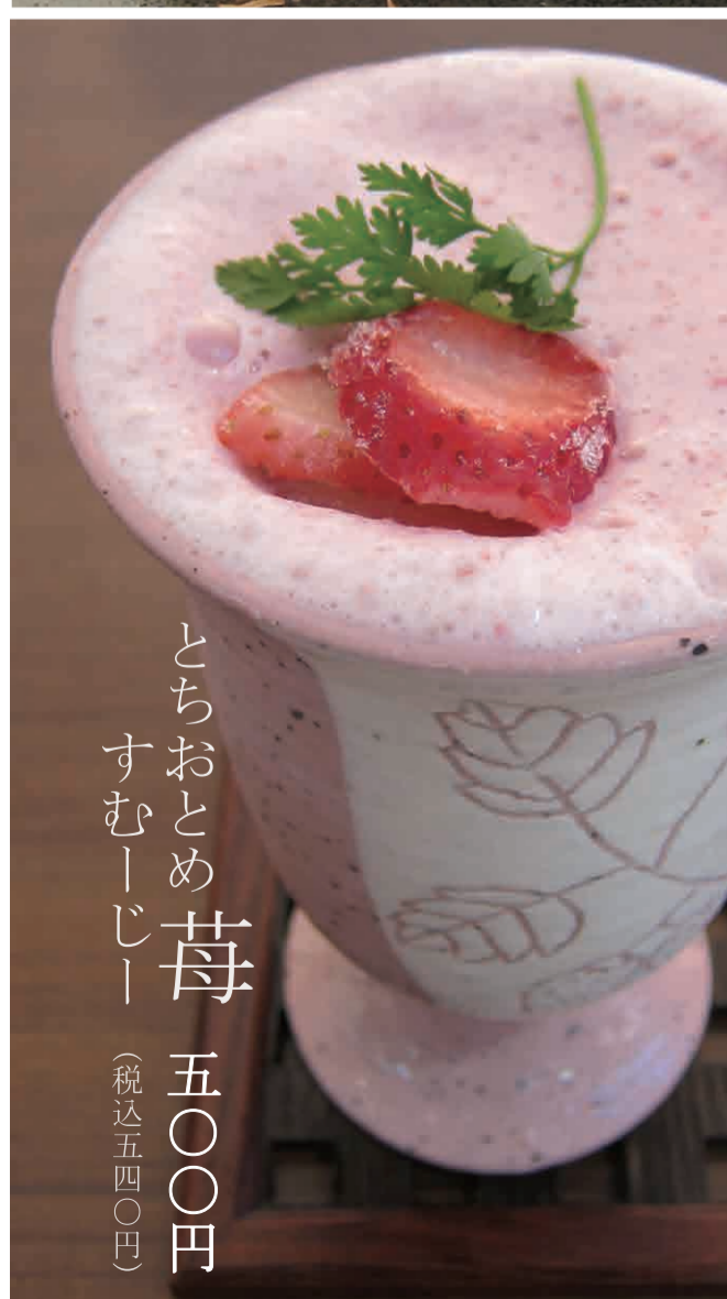
とちおとめ苺 すむーじー 五〇〇円 (税込五四〇円)