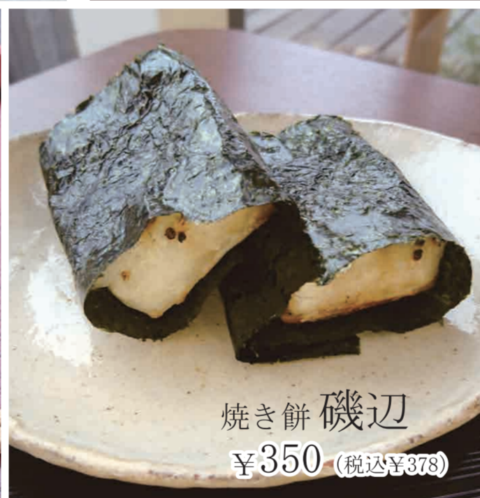
焼き餅 磯辺 ¥350 (税込 ¥378)