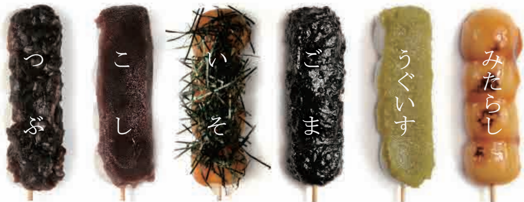
焼きたてだんご 各120円 (税込130円)