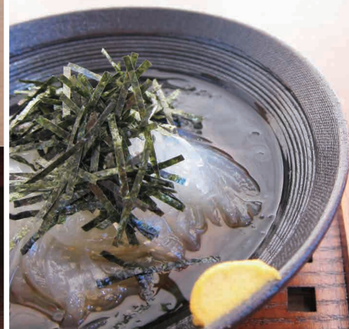
ところ天 四〇〇円 (税込四三三円)