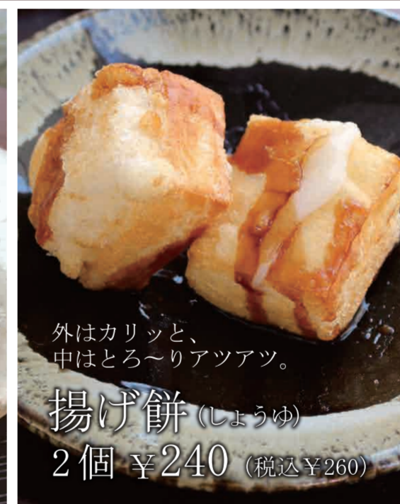
揚げ餅 (しょうゆ) 2個 ¥240 (税込 ¥260)