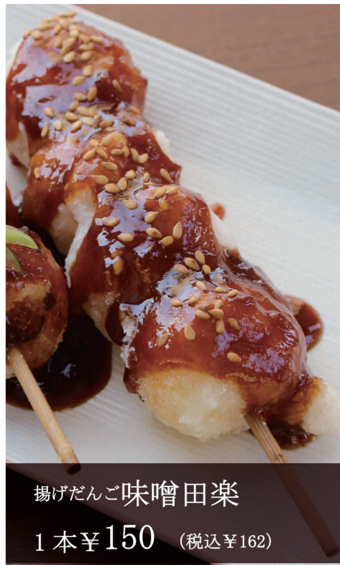
揚げだんご味噌田楽 1本 ¥150 (税込 ¥162)