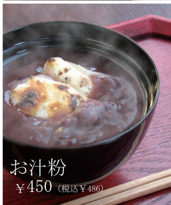
お汁粉 ¥450 (税込 ¥486)