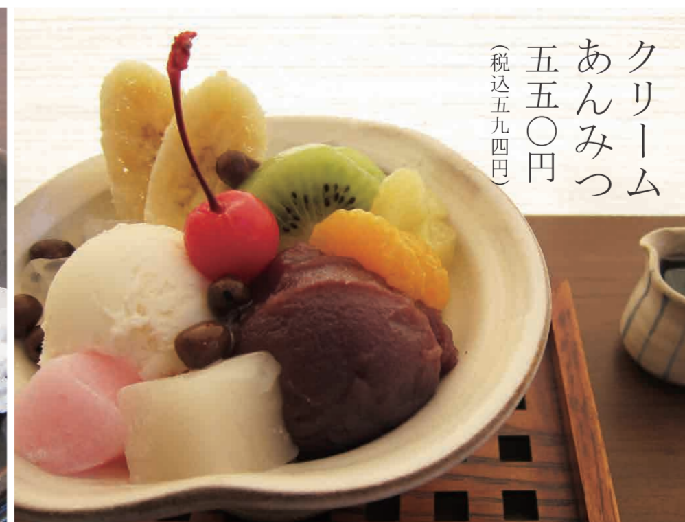
クリーム あんみつ 五五〇円 (税込五九四円)