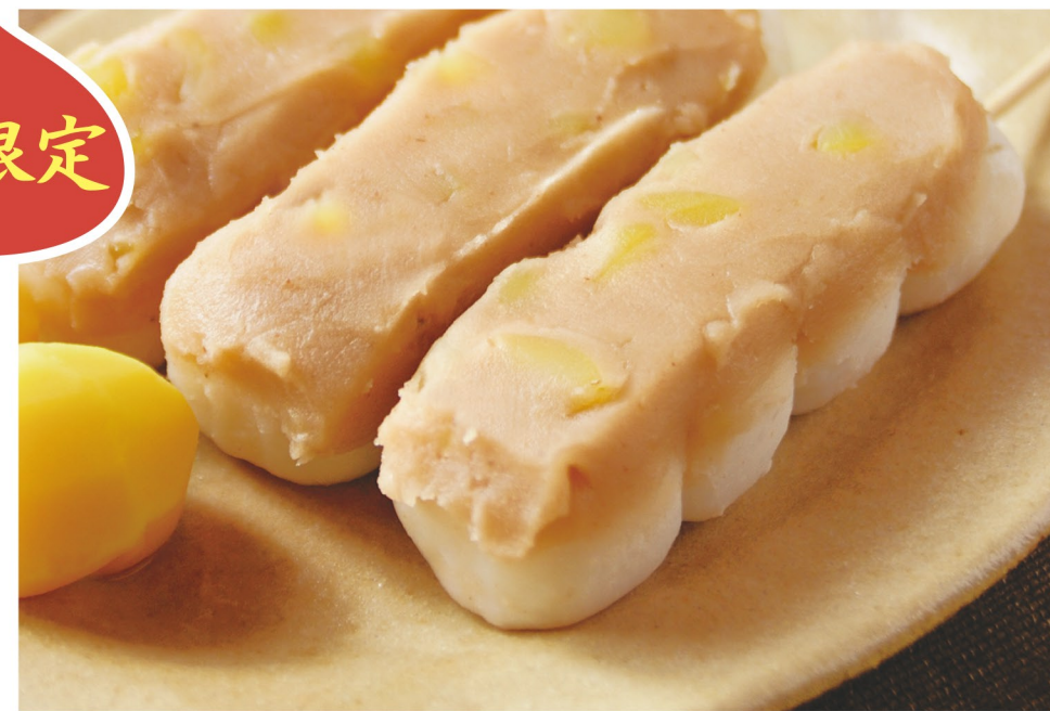
コクのある栗あんの中のきざみ栗が食感のアクセント。 焼きたてだんご栗あん 1本 140円 (税込154円)