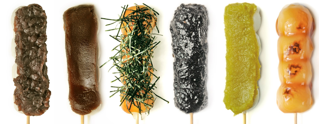
焼きたてだんご つぶ、こし、いそ、ごま、うぐいす、みたらし 各1本 120円 (税込132円)