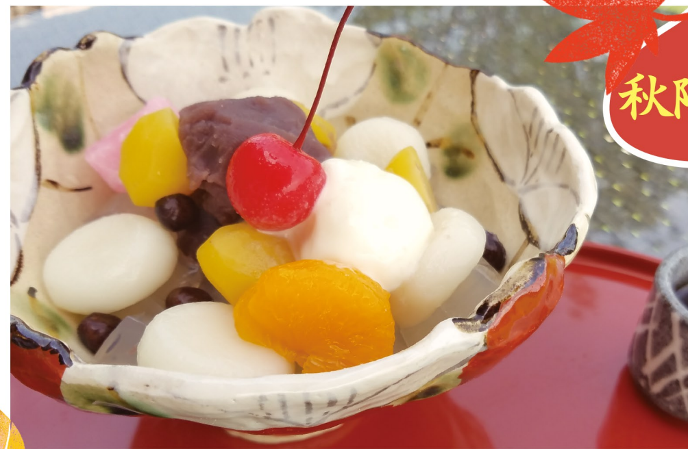
ほっくり栗ともっちり白玉 白玉栗あんみつ 650円 (税込715円)