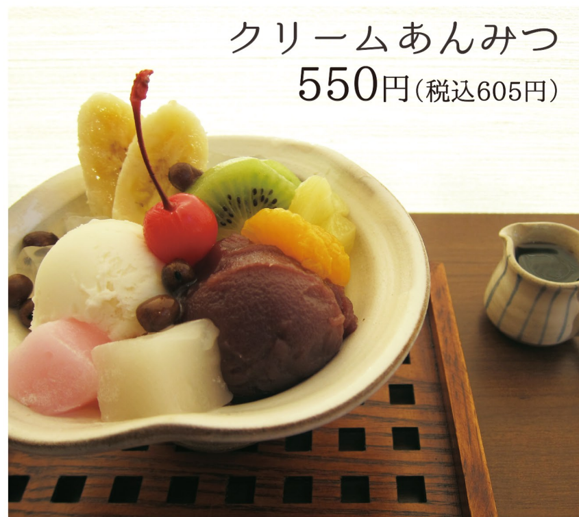
クリームあんみつ 550円 (税込605円)