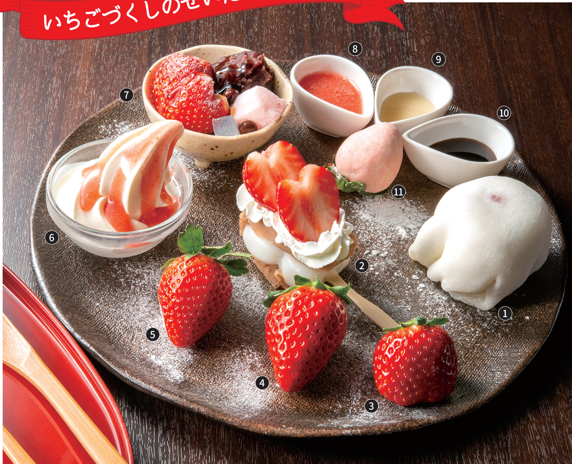
①いちご練乳クリーム大福 ②ハートの苺だんご ③とちあいか ④スカイベリー ⑤とちおとめ ⑥ソフトクリームいちごソースがけ ⑦いちごあんみつ ⑧武平作特製いちごソース ⑨練乳ソース ⑩武平作特製黒蜜 ⑪まるごと苺チョコ