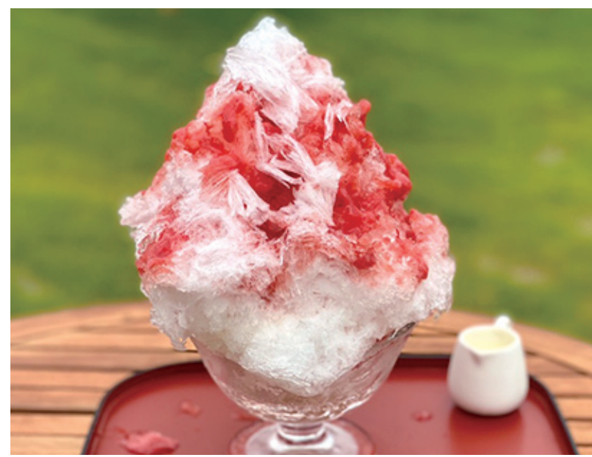
いちごみるく 本体価格¥900 (税込価格¥990) 【特定原材料及びそれに準ずるもの】乳、ゼラチン