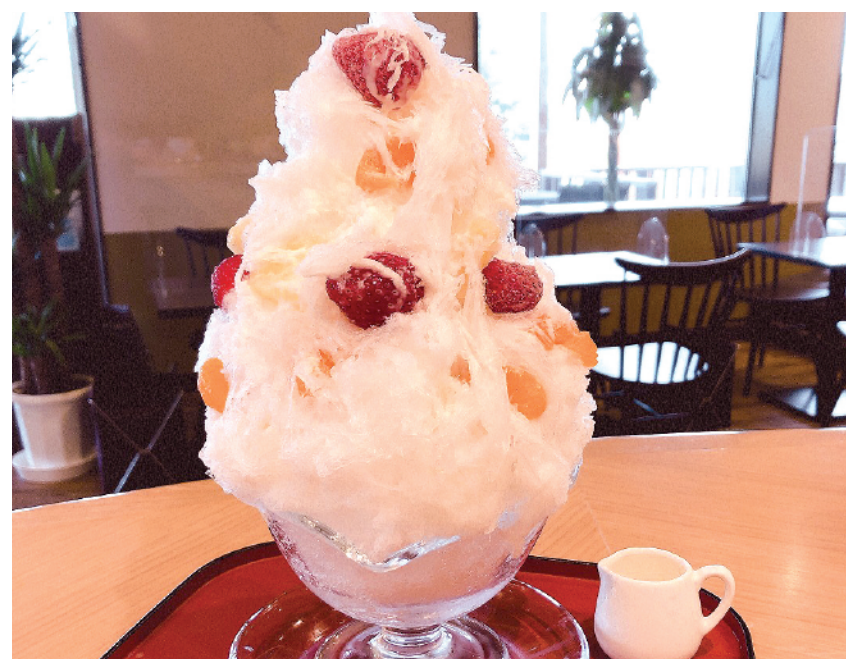
しろくま 本体価格¥900 (税込価格¥990) 【特定原材料及びそれに準ずるもの】乳、ゼラチン