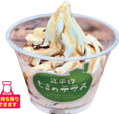
きなこ黒蜜 本体価格¥380 (お持ち帰り 税込価格¥410) 店内ご飲食 (税込価格¥418) 【特定原材料及びそれに準ずるもの】乳、大豆