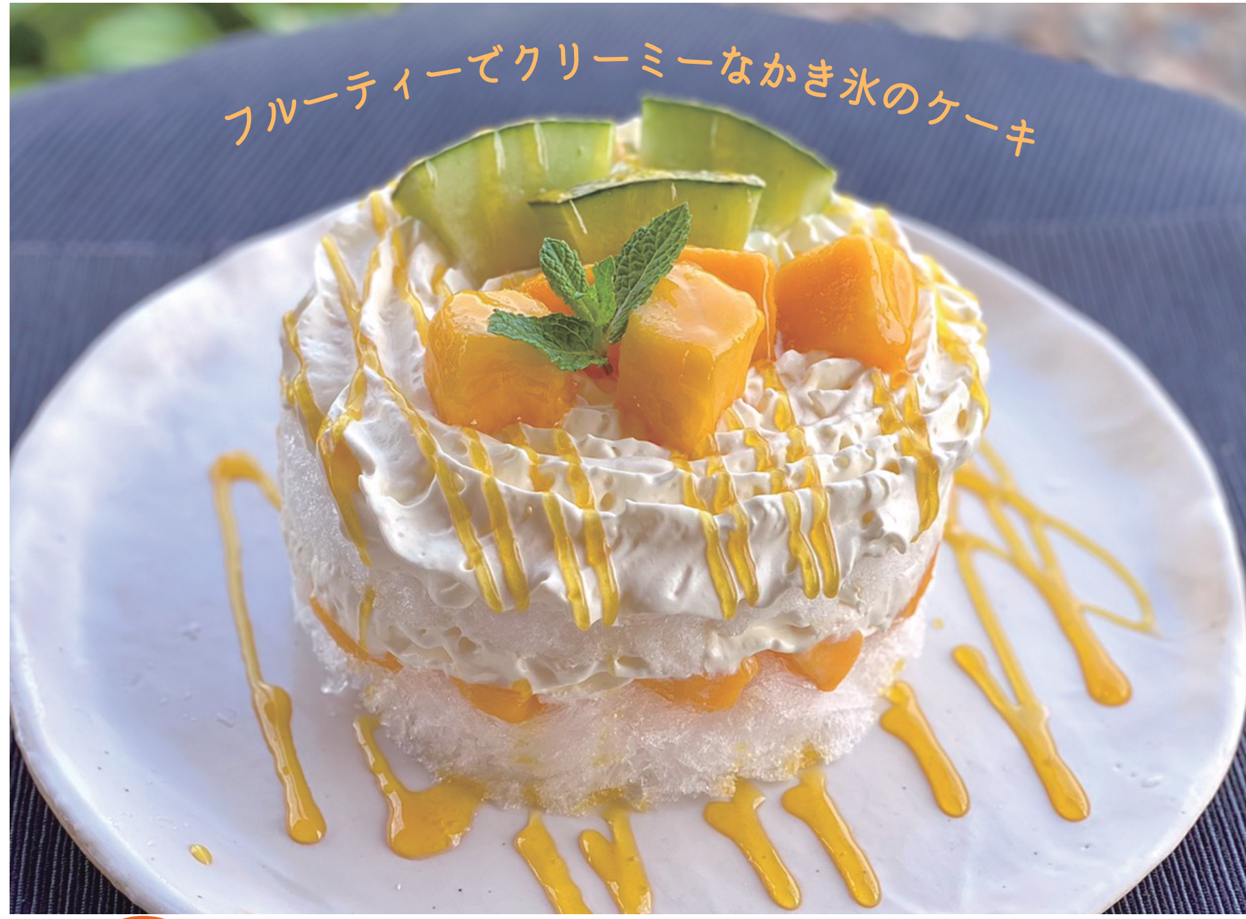
数量限定 デコレーションマンゴークリーム 本体価格¥1,400 (税込価格¥1,540) 【特定原材料及びそれに準ずるもの】乳、ゼラチン、りんご ※トッピングのフルーツは変更になる場合があります