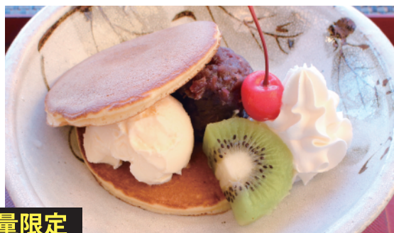
数量限定 小倉どら焼きーフルーツ添え 本体価格¥580 (税込価格¥638) 【特定原材料及びそれに準ずるもの】乳、小麦、大豆 ※フルーツは変更になります