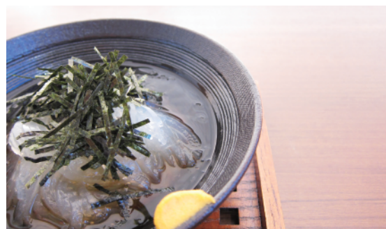
ところてん 本体価格¥450 (税込価格¥495) 【特定原材料及びそれに準ずるもの】小麦、大豆