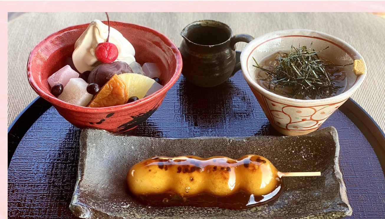
味の散歩道 焼きたてだんご、クリームあんみつ、ところてんのセット 本体価格¥820 (税込価格¥902) 【特定原材料及びそれに準ずるもの】乳、小麦、大豆、ごま ※焼きたてだんご・ごまの場合