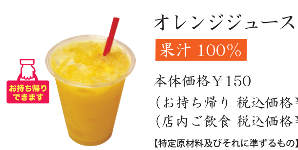
オレンジジュース 果汁100% 本体価格¥150 (お持ち帰り 税込価格¥162) (店内ご飲食 税込価格¥165) 【特定原材料及びそれに準ずるもの】オレンジ