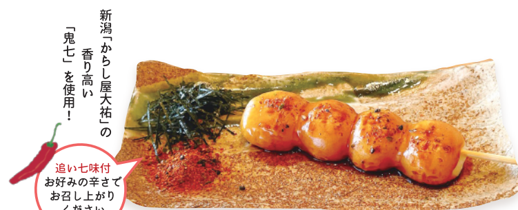
焼きたてだんご 七味 醤油たれに香りのよい七味をふった、ピリリと辛い武平作初のだんごです！ 1本 本体価格¥180 (税込価格¥198) 【特定原材料及びそれに準ずるもの】小麦、大豆、ごま