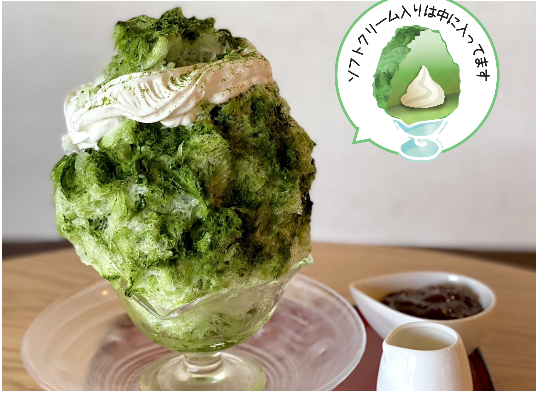
抹茶クリーム 小豆・みるく付 本体価格¥950 (税込価格¥1,045)