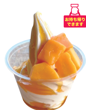
アップルマンゴー 本体価格¥480 (お持ち帰り 税込価格¥518) 店内ご飲食 (税込価格¥528) 【特定原材料及びそれに準ずるもの】乳、りんご