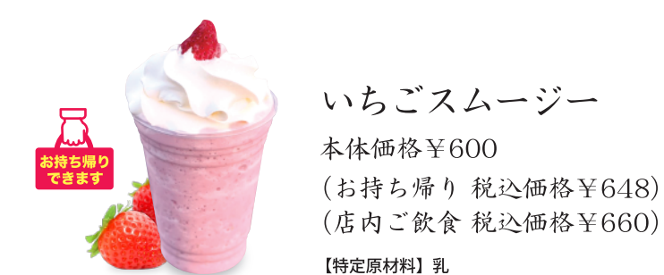
いちごスムージー 本体価格¥600 (お持ち帰り 税込価格¥648) (店内ご飲食 税込価格¥660) 【特定原材料】乳