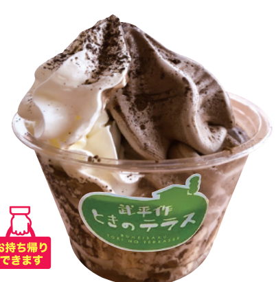
濃厚ほうじ茶 本体価格¥450 (お持ち帰り 税込価格¥486) 店内ご飲食 (税込価格¥495) 【特定原材料】乳