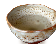
お団子と一緒にどうぞ 梅こんぶ茶 単品 【特定原材料】なし