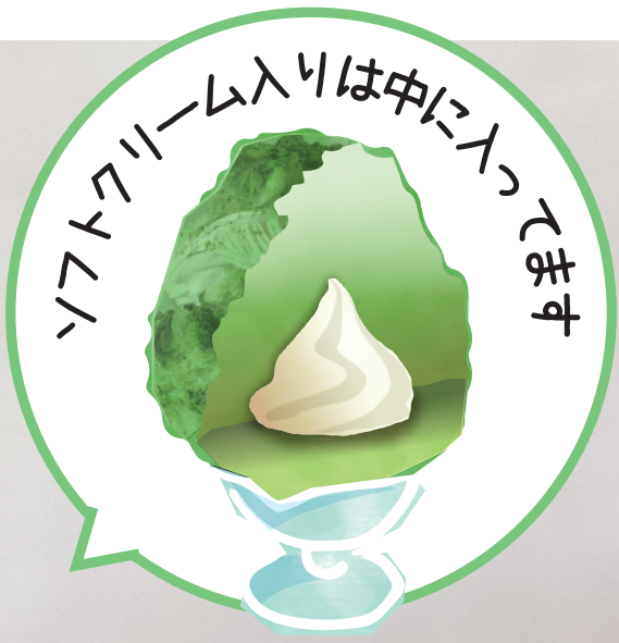
抹茶クリーム ソフトクリーム入 本体価格¥1,100 (税込価格¥1,210) 【特定原材料及びそれに準ずるもの】乳、ゼラチン