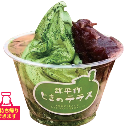
抹茶あずき 本体価格¥450 (お持ち帰り 税込価格¥486) 店内ご飲食 (税込価格¥495) 【特定原材料】乳