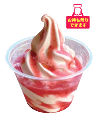
ソフトクリーム いちごソースかけ 本体価格¥450 (お持ち帰り 税込価格¥486) 店内ご飲食 (税込価格¥495) 【特定原材料】乳