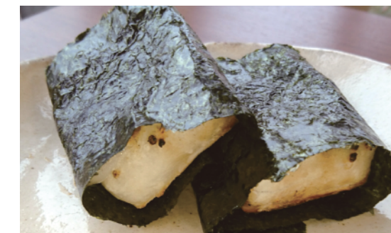
焼き餅 磯辺(2切) 本体価格¥380 (税込価格¥418) 【特定原材料及びそれに準ずるもの】小麦、大豆