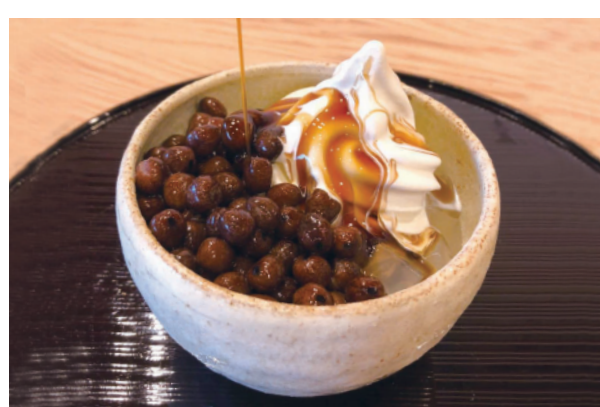
クリーム豆かん 本体価格¥650 (税込価格¥715) 【特定原材料】小麦