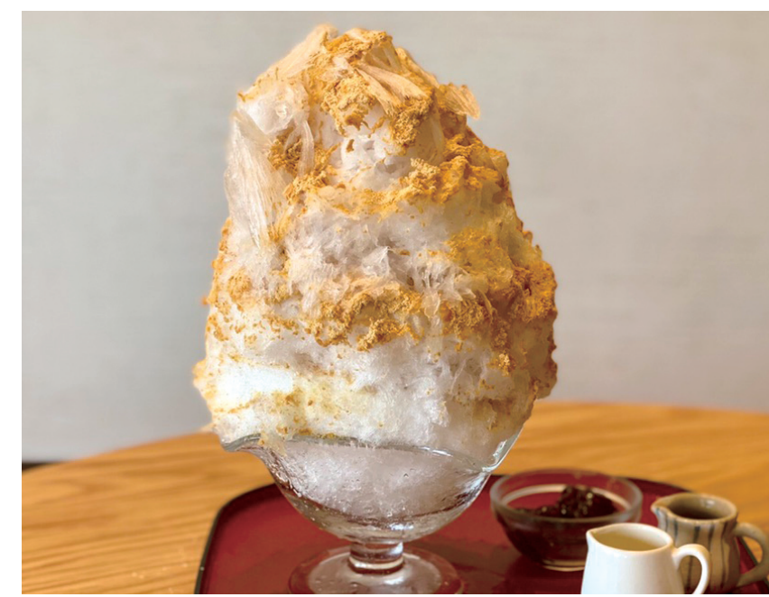
きな粉黒蜜みるく 本体価格¥900 (税込価格¥990) 【特定原材料及びそれに準ずるもの】乳、ゼラチン