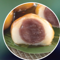
なめらかで 口どけのよい こしあん入