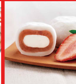
とちぎ苺生クリーム入大福