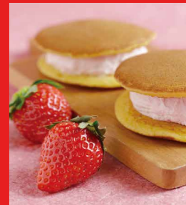
いちごクリーム生どら焼き