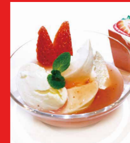
空苺の純愛フロマーージュブラン