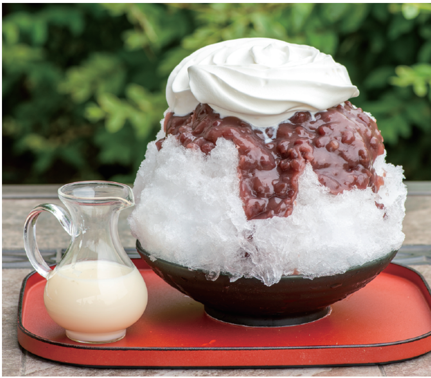
武平作特製つぶあん、生クリームやミルクソースとの相性が、究極至極！まさに「理想の小豆みるく」 なめらか粒あんの 本体価格¥980 小豆生クリーム (ミルク付き) (税込価格¥1,078) 【特定原材料及びそれに準ずるもの】乳成分、ゼラチン