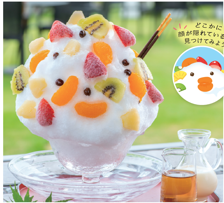
武平作特製のミルクソースに盛り盛りフルーツ！ しろくま 本体価格¥1,080 (税込価格¥1,188) 【特定原材料及びそれに準ずるもの】乳成分、小麦、大豆、ゼラチン、キウイフルーツ