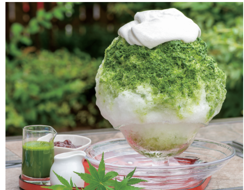
抹茶がメインだけ「粒あん」と「ミルク」、 「濃い抹茶」などがたっぷり付いた和スイーツだ！ 宇治抹茶生クリーム 本体価格¥1,080 (つぶあん&濃い抹茶ソース&ミルク付き) (税込価格¥1,188) 【特定原材料及びそれに準ずるもの】乳成分、ゼラチン