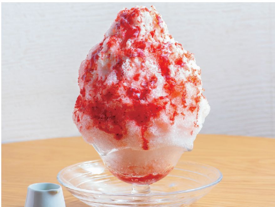
「本物の苺」を味わえる武平作特製「生苺ソース」 谷中農園の苺で作った 苺ソースの苺ミルク 本体価格¥980 (苺ソース&ミルク付き) (税込価格¥1,078) 【特定原材料及びそれに準ずるもの】乳成分、ゼラチン