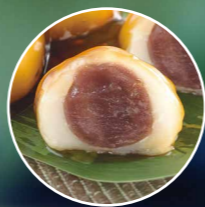
なめらかで 口どけのよい こしあん入