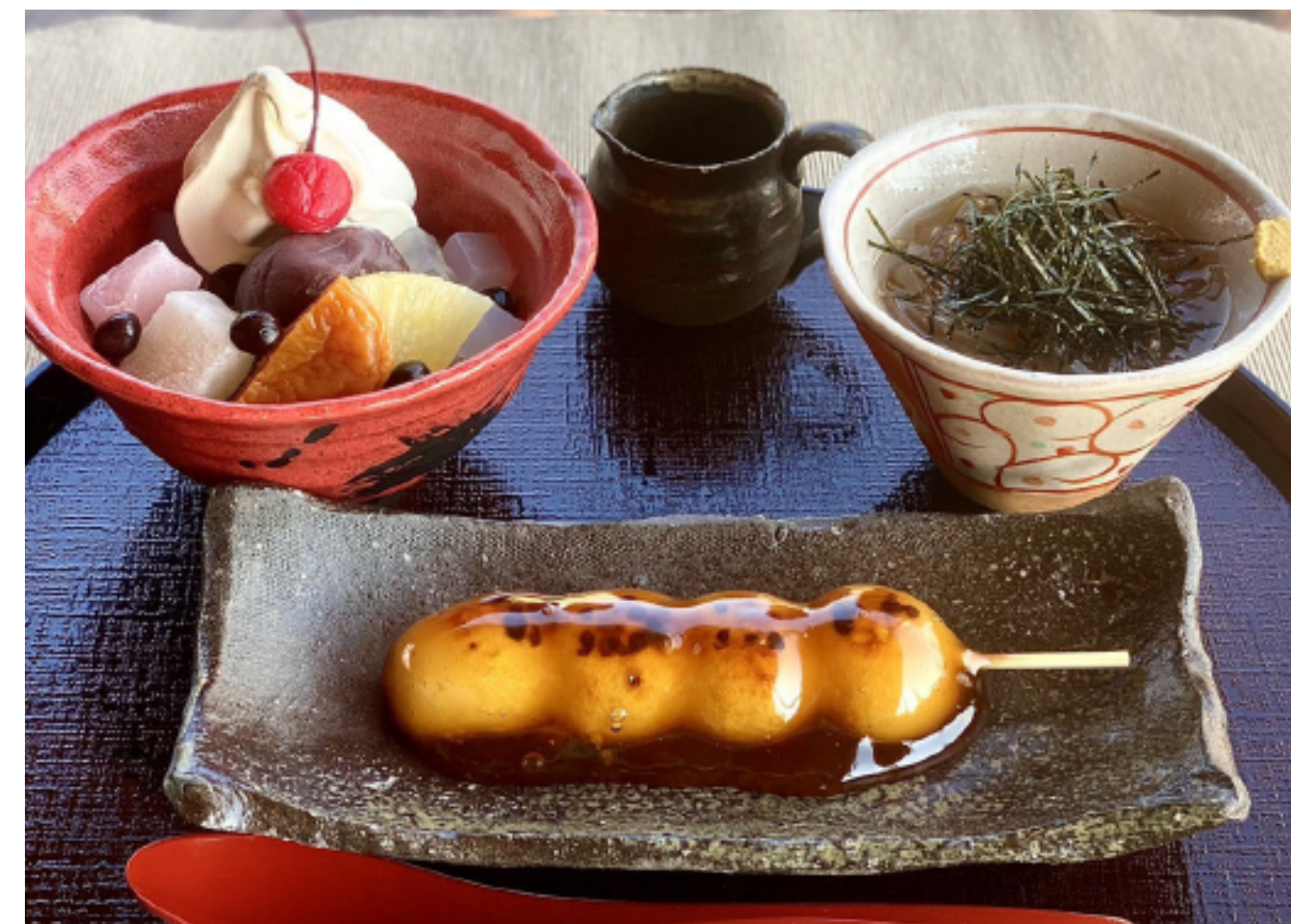
味の散歩道 本体価格 ¥1,020 (税込価格 ¥1,122)

焼きたてだんご、クリームあんみつ、ところてんのセットが選べます。お好きなおだんご(焼きたてだんご、特製だんご、揚げだんご、桜あんだんご)が選べます。※印のついたおだんごは本体価格に+30円です。