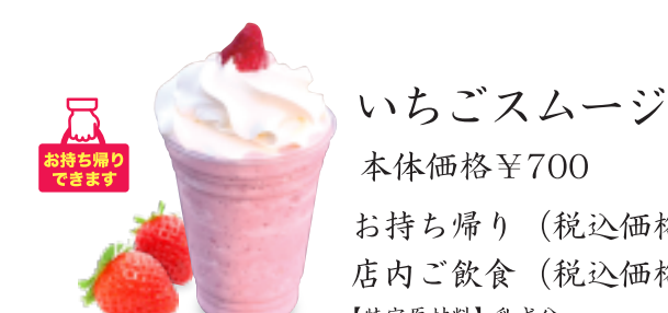
いちごスムージー 本体価格 ¥700 お持ち帰り (税込価格 ¥756) 店内ご飲食 (税込価格 ¥770)

梅こんぶ茶 【特定原材料】なし 茶屋メニューとセットで 単品 本体価格 ¥100 (税込価格 ¥110) 本体価格 ¥150 (税込価格 ¥165)