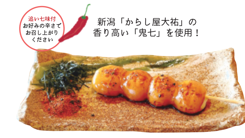
焼きたてだんご 七味