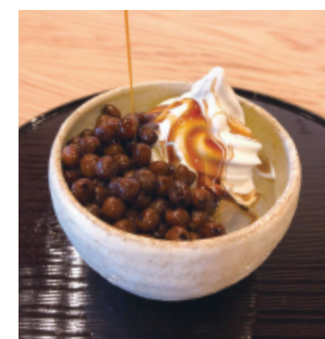
クリーム豆かん 本体価格 ¥680 (税込価格 ¥748)