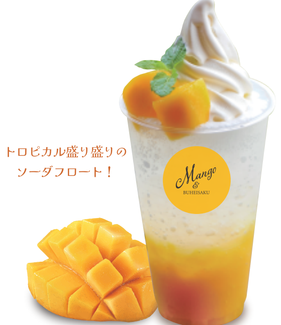
アップルマンゴークラッシュフロート 本体価格 ¥750 お持ち帰り (税込 ¥810) 店内ご飲食 (税込 ¥825)