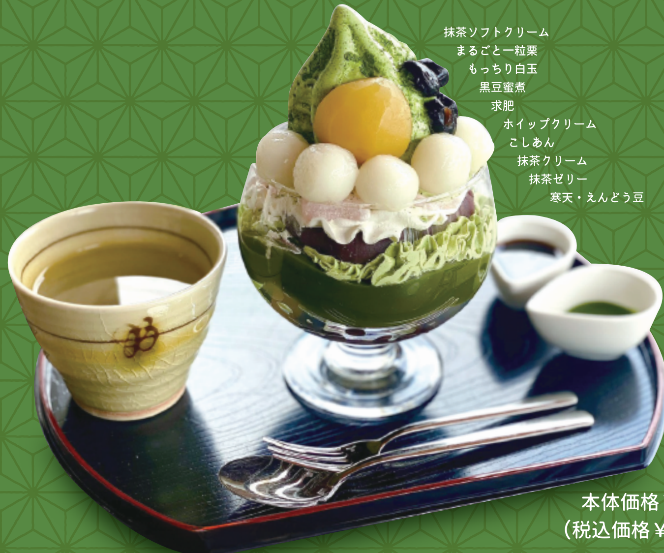
抹茶白玉 あんみつパフェ 黒蜜と抹茶ソース添え