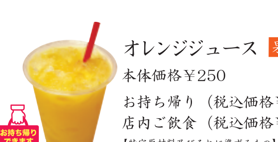
オレンジジュース 果汁100% 本体価格 ¥250 お持ち帰り (税込価格 ¥270) 店内ご飲食 (税込価格 ¥275)

コーヒー 【特定原材料】なし 【ホット】 本体価格 ¥100 お持ち帰り (税込価格 ¥108) 店内ご飲食 (税込価格 ¥110) 【アイス】 本体価格 ¥150 お持ち帰り (税込価格 ¥162) 店内ご飲食 (税込価格 ¥165)