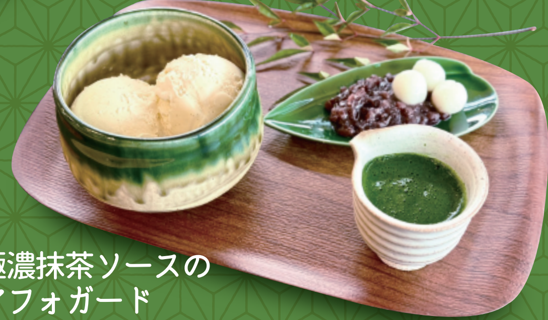
極濃抹茶ソースのアフォガード

① 極濃抹茶ソースのアフォガード ② 抹茶テリマ金粉のせ (黒豆添え) ③ 田楽 ④ 抹茶わらび餅 ⑤ マンゴー啗にごろっと果肉のせ ⑥ ドライオレンジ ⑦ 抹茶白玉あんみつ ⑧ 特製黒蜜