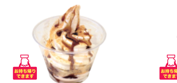
きなこ黒蜜 本体価格 ¥460 お持ち帰り (税込 ¥497) 店内ご飲食 (税込 ¥506)