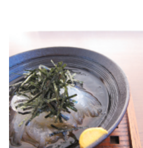
ところてん 本体価格 ¥470 (税込価格 ¥517)