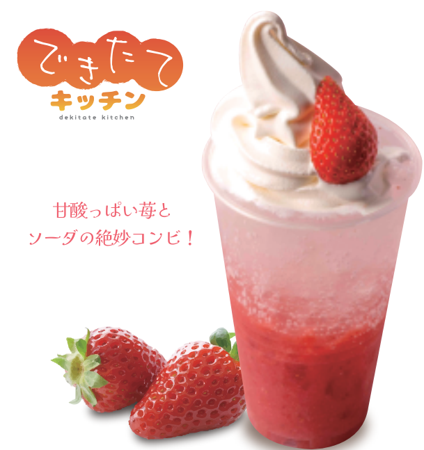
生莓クラッシュフロート 本体価格 ¥750 お持ち帰り (税込 ¥810) 店内ご飲食 (税込 ¥825)