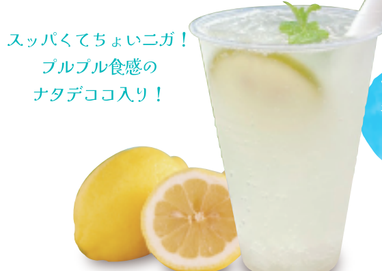
スパニガ! 夏レモネードソーダ! in ナタデココ 本体価格 ¥550 お持ち帰り (税込 ¥594) 店内ご飲食 (税込 ¥605)