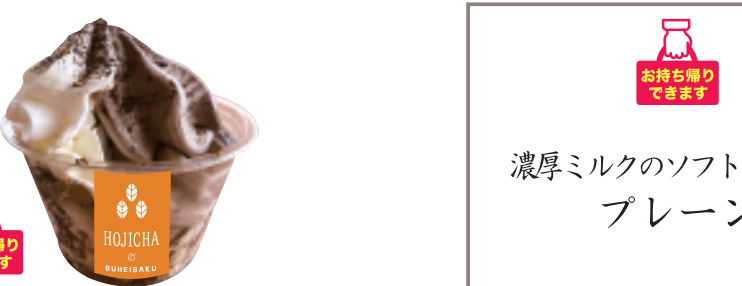
濃厚ほうじ茶 本体価格 ¥480 お持ち帰り (税込 ¥518) 店内ご飲食 (税込 ¥528)

濃厚ミルクソフトクリーム プレーン 本体価格 ¥360 お持ち帰り (税込 ¥389) 店内ご飲食 (税込 ¥396)