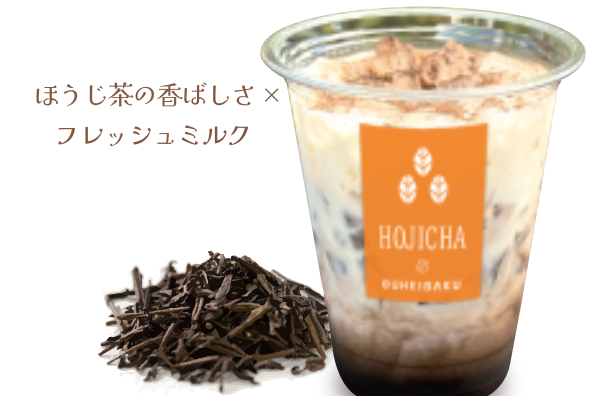
ほうじ茶ラテ 本体価格 ¥400 お持ち帰り (税込 ¥432) 店内ご飲食 (税込 ¥440)

【特定原材料及びそれに準ずるもの】乳成分・小麦・大豆・ごま (※焼きたてだんご・ごまの場合) ※はちみつ