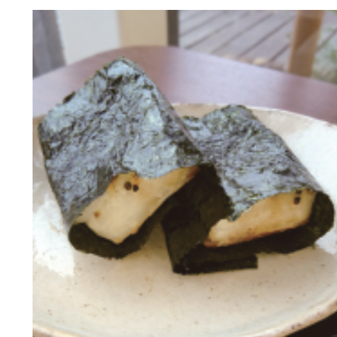
焼き餅 磯辺 (2切) 本体価格 ¥450 (税込価格 ¥495)

コーヒー 【特定原材料】なし 【ホット】 本体価格 ¥100 お持ち帰り (税込価格 ¥108) 店内ご飲食 (税込価格 ¥110) 【アイス】 本体価格 ¥150 お持ち帰り (税込価格 ¥162) 店内ご飲食 (税込価格 ¥165)